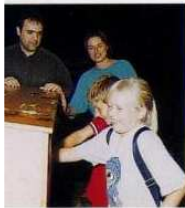
Der Waldsinnespfad zwischen den idyllisch gelegenen Ottweiler Stadtteilen Steinbach und Fürth:

In einem großen Fühlkasten stecken viele Geheimnisse, die es zu entdecken gilt. Wer errät am schnellsten, dass es sich um Steine, Zweige, Laub oder Tannenzapfen handelt? Die Freude an der Überraschung ist auf alle Fälle garantiert und riesengroß!